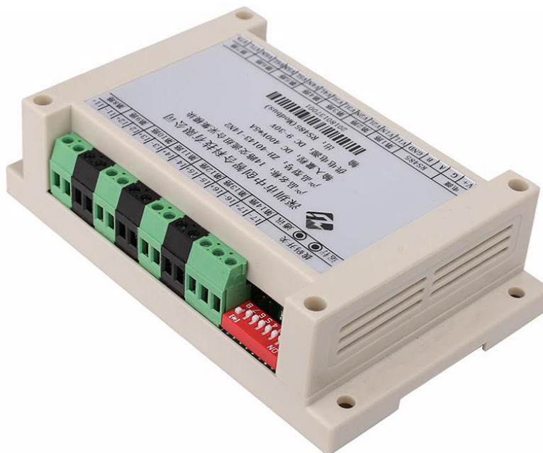
图一、产品实物图（导轨安装或螺钉）

外观尺寸：145X90X40 mm，螺钉安装尺寸,135X70mm，安装孔径 \phi 5mm